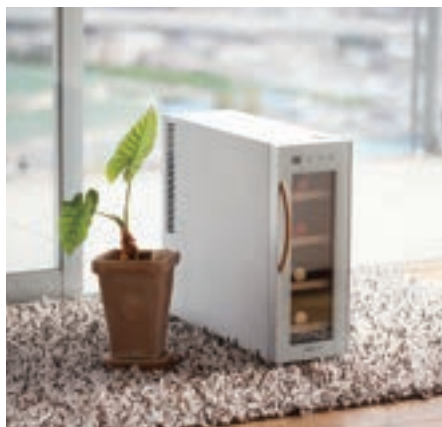
CE-4W-W 4-BOTTLE CELLAR